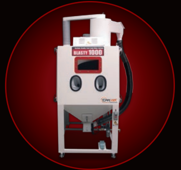
※ボックス扉無し標準モデル