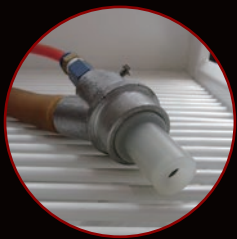
タングステン製 高耐久ノズル