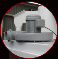
ハイパワー集塵 ブロアモーター