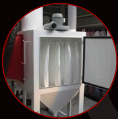
集塵機一体型で コンパクト