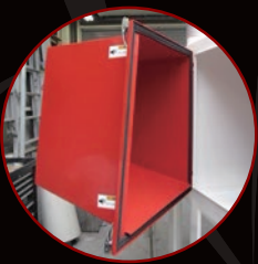
2mの長尺物に対応 (オプション:ボックス扉)