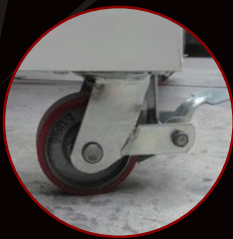
移動に便利な キャスター付